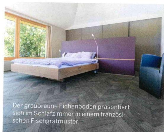
Der graubraune Eichenboden präsentiert sich im Schlafzimmer in einem französischen Fischgratmuster.

«Das Parkett hält, was es hinsichtlich Pflege und Unterhalt verspricht.»