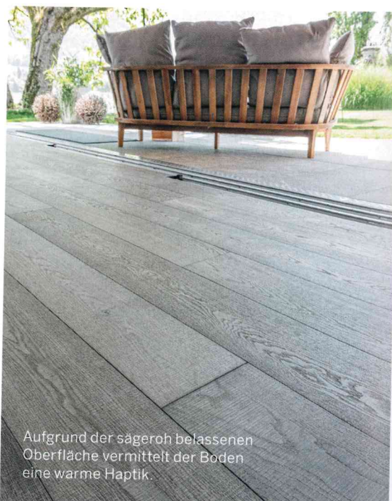
Aufgrund der sägeroh belassenen Oberfläche vermittelt der Boden eine warme Haptik.